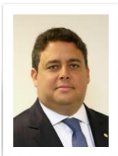
FELIPE SANTA CRUZ Presidente Nacional